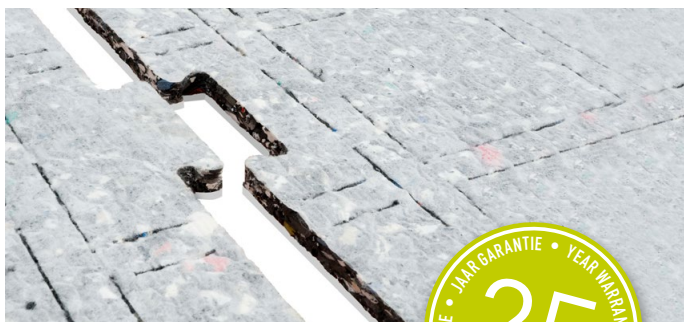
Puzzelförmige ProPlay® – mit Expansionsschlitzen